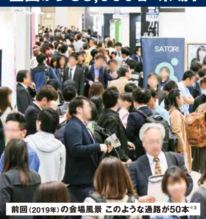
前回(2019年)の会場風景 このような通路が50本*

出展 まだ間に合います 出展社を追加募集! お問い合わせ → Tel: 03-3349-8507